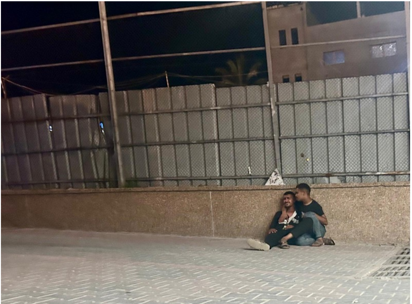
Imagen 77: Un joven llora desconsoladamente junto a las puertas de Urgencias, lamentando la muerte a manos del ejército israelí de un amigo o familiar. Las imágenes de mujeres y hombres llorando por la muerte prematura y violenta de sus seres queridos son constantes, al igual que los bombardeos. (Jan Yunis, 29 de mayo de 2025).