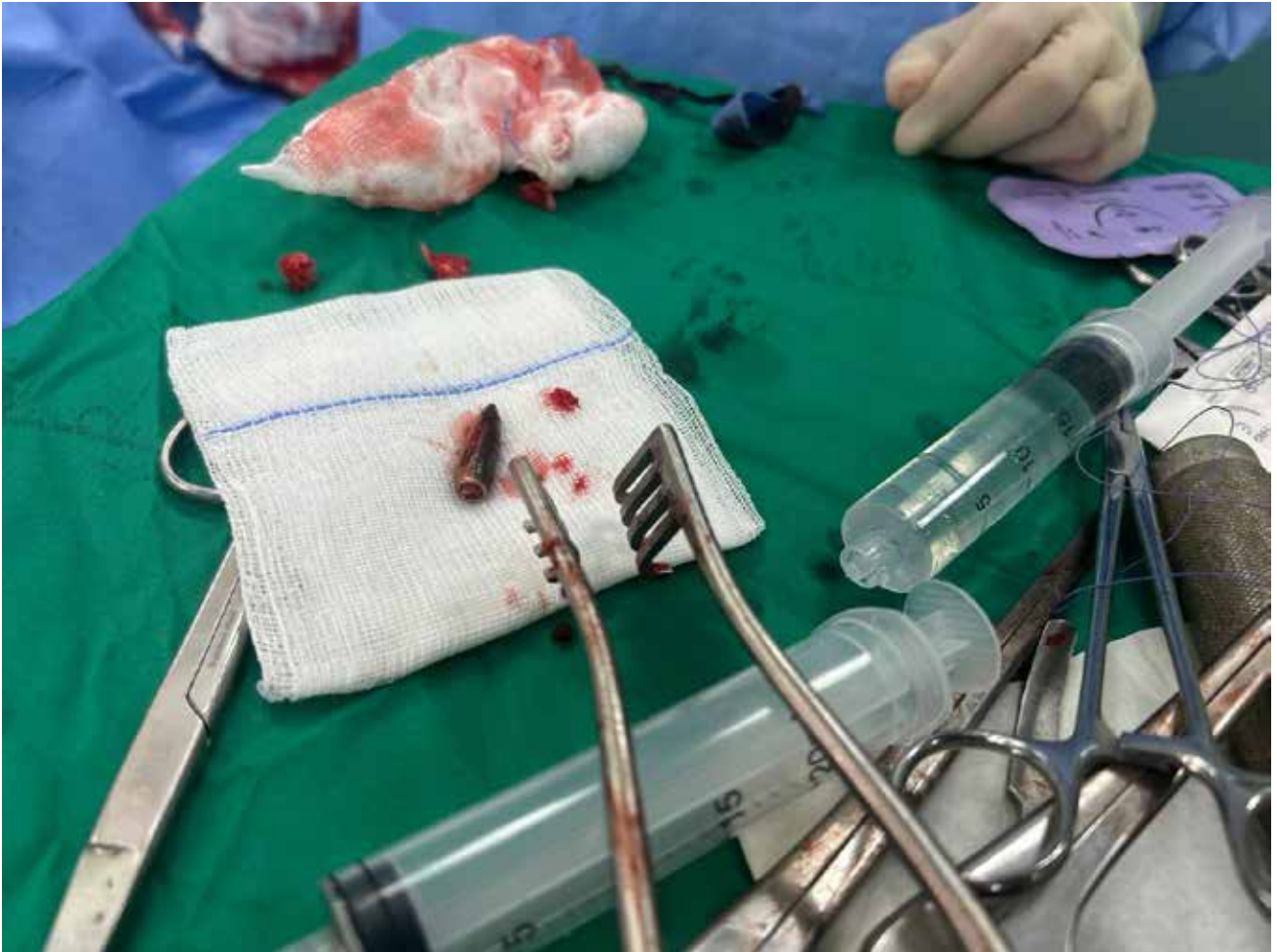
Imagen 110: Bala extraída de la columna vertebral de Salem, de 18 años. La bala entró por la parte anterior del tórax y se alojó en la columna vertebral, dañando la médula espinal. (Jan Yunis, 9 de junio de 2025).