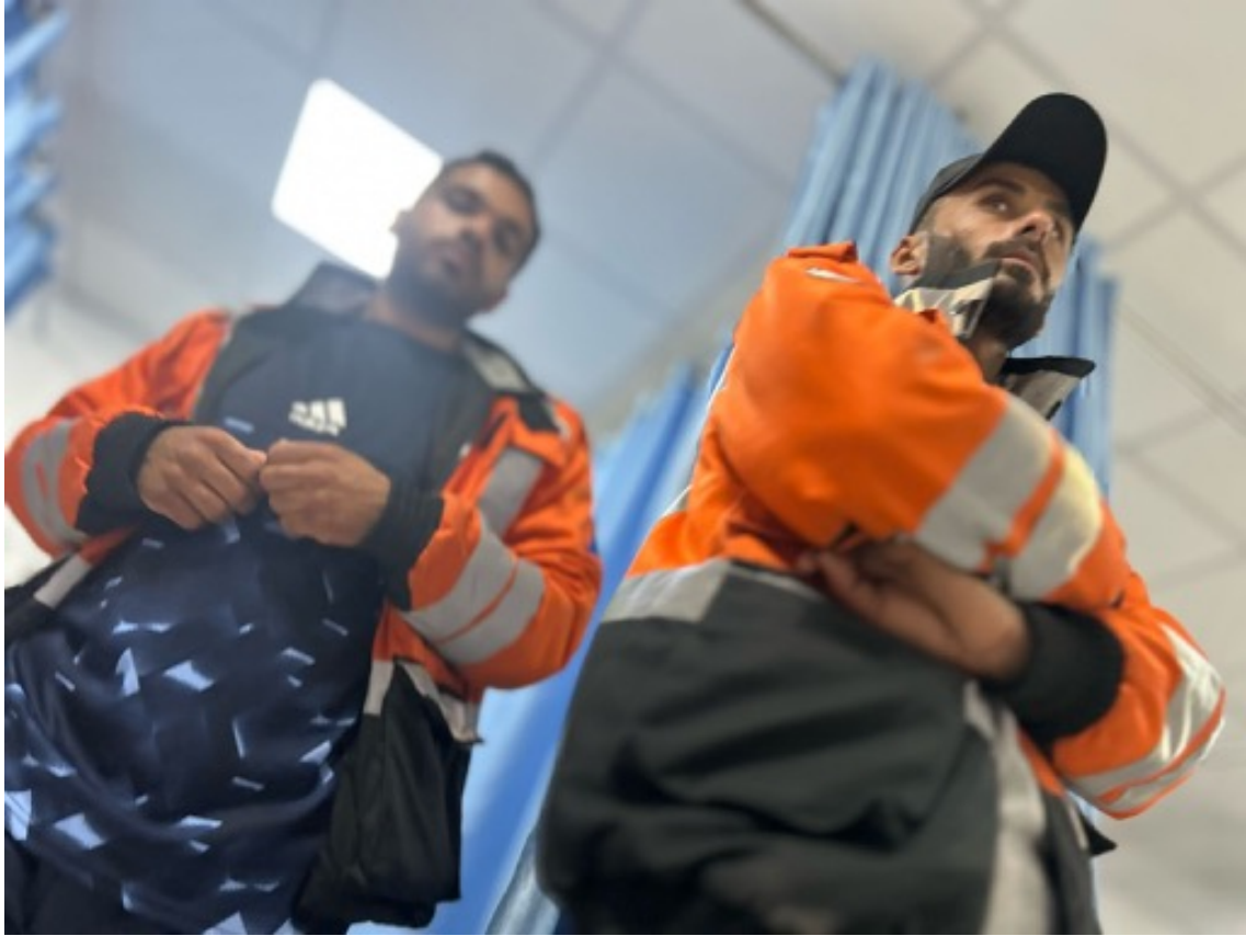
Imagen 2: Trabajadores de de la Protección Civil esperan en Urgencias mientras algunos de sus compañeros, heridos, son atendidos. Los rescatistas fueron bombardeados mientras socorrían a civiles atrapados en un edificio que había sido bombardeado previamente. (Jabalia, 22 de abril de 2025).