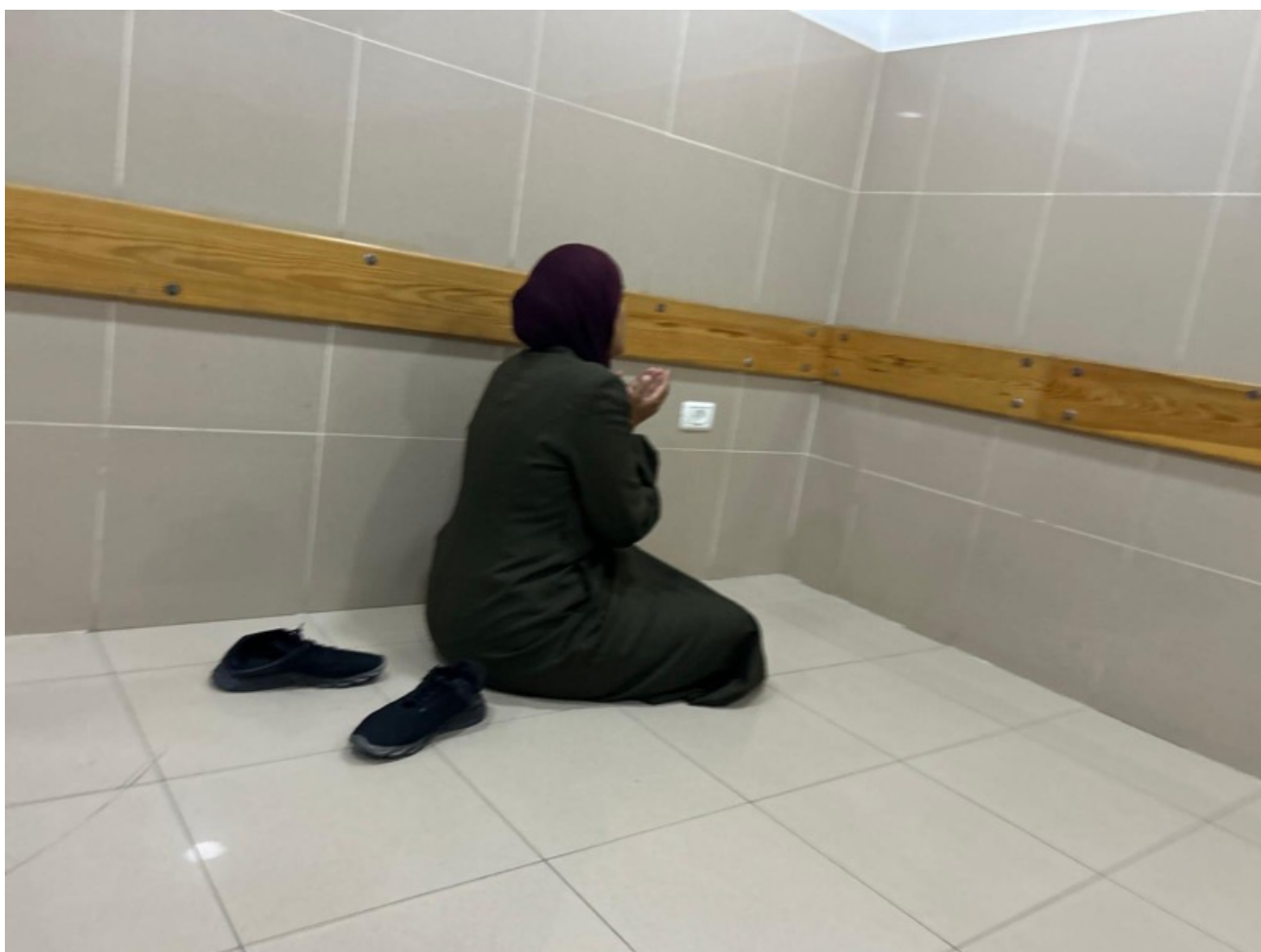
Imagen 80: Una mujer reza en el suelo del pasillo del hospital por la vida de un familiar ingresado en la UCI. Entre los gritos, lágrimas y desmayos de los parientes, se escuchan oraciones en los pasillos por los heridos y, en la morgue, por los fallecidos. (Jan Yunis, 1 de junio de 2025).