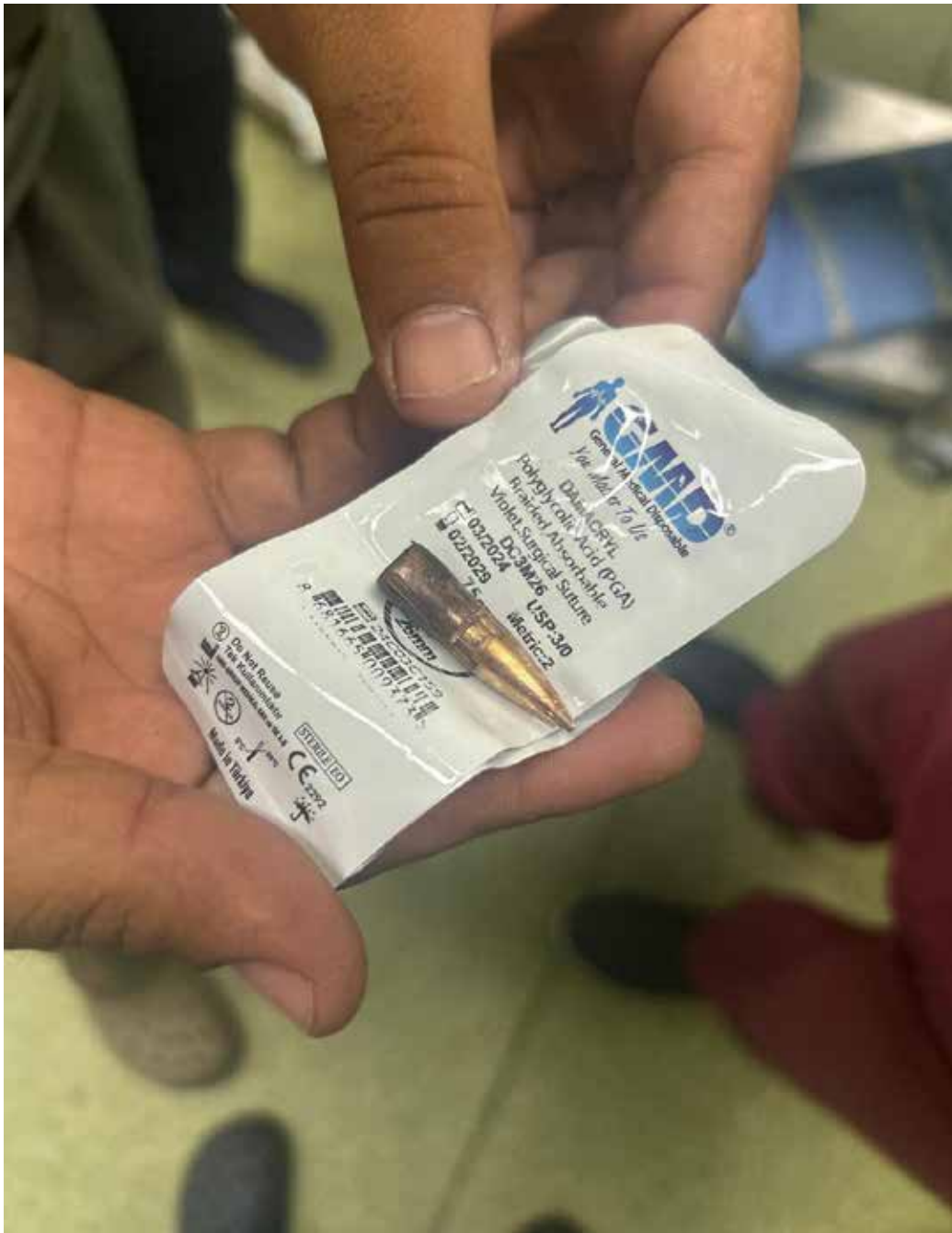
Imagen 149: Bala de fusil extraída del abdomen de Abdelkarim, muchacho de 15 años, quien fue disparado por el ejército israelí. Presenta severas lesiones internas y shock hemorrágico, y su pronóstico es muy negativo. (Jan Yunis, 3 de julio de 2025).