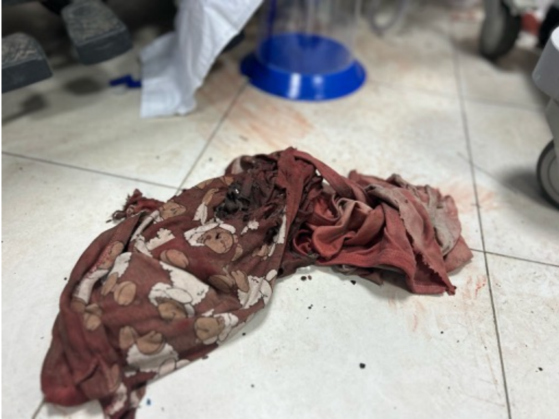
Imagen 18: Camiseta de Shahed, niña de 6 años, en el suelo del box de críticos. Un bombardeo israelí le causó mutilaciones y un traumatismo craneoencefálico grave. Falleció pocas horas más tarde. (Jabalia, 28 de abril de 2025).