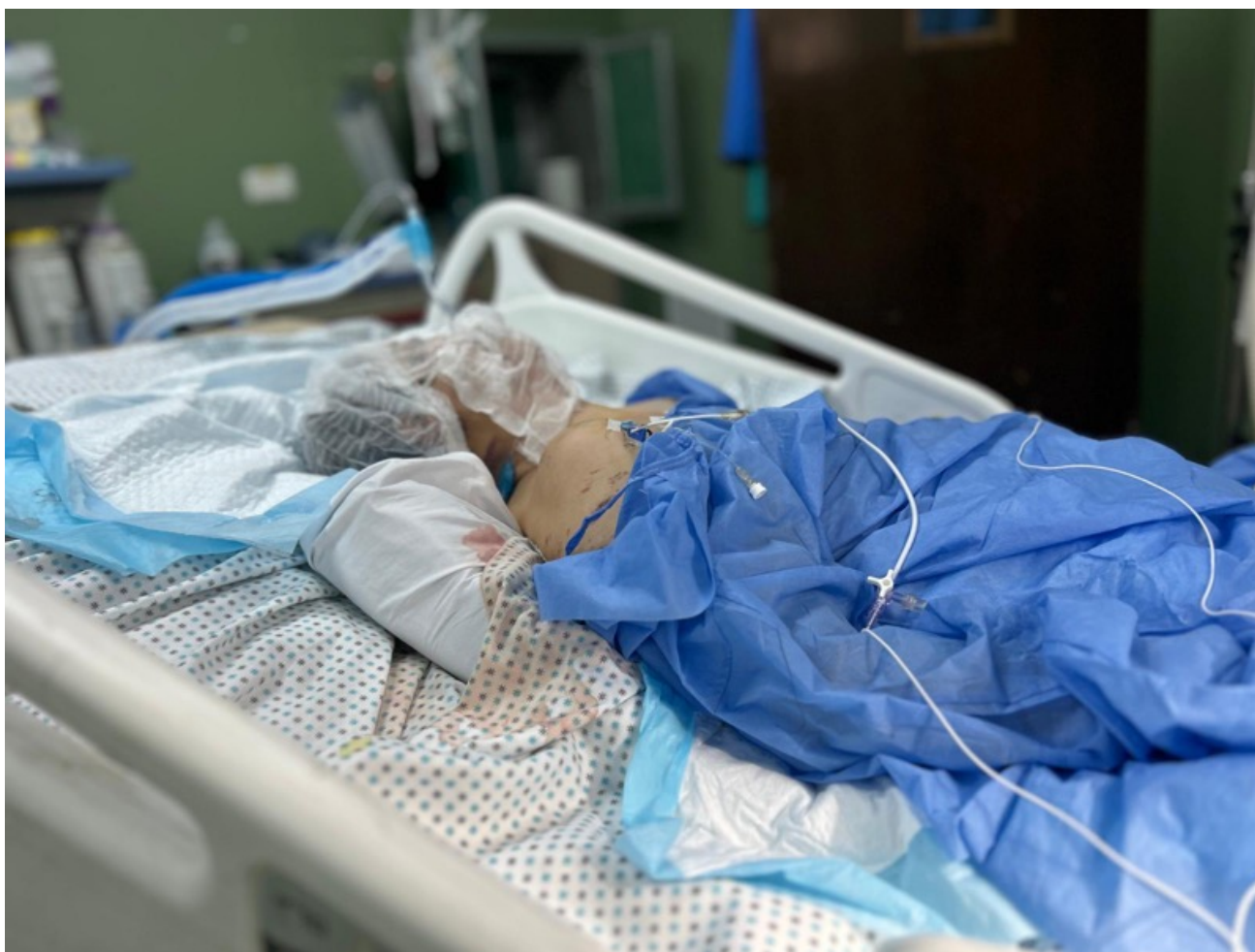
Imagen 68: Falastin, de 62 años, justo antes de ser operada para estabilizar sus fracturas de las piernas y desbridar sus numerosas heridas cutáneas y musculares, muchas de las cuales están infectadas. Además, sufre una hemorragia cerebral severa que la mantiene en coma. Las lesiones fueron causadas por un bombardeo israelí. (Jan Yunis, 26 de mayo de 2025).