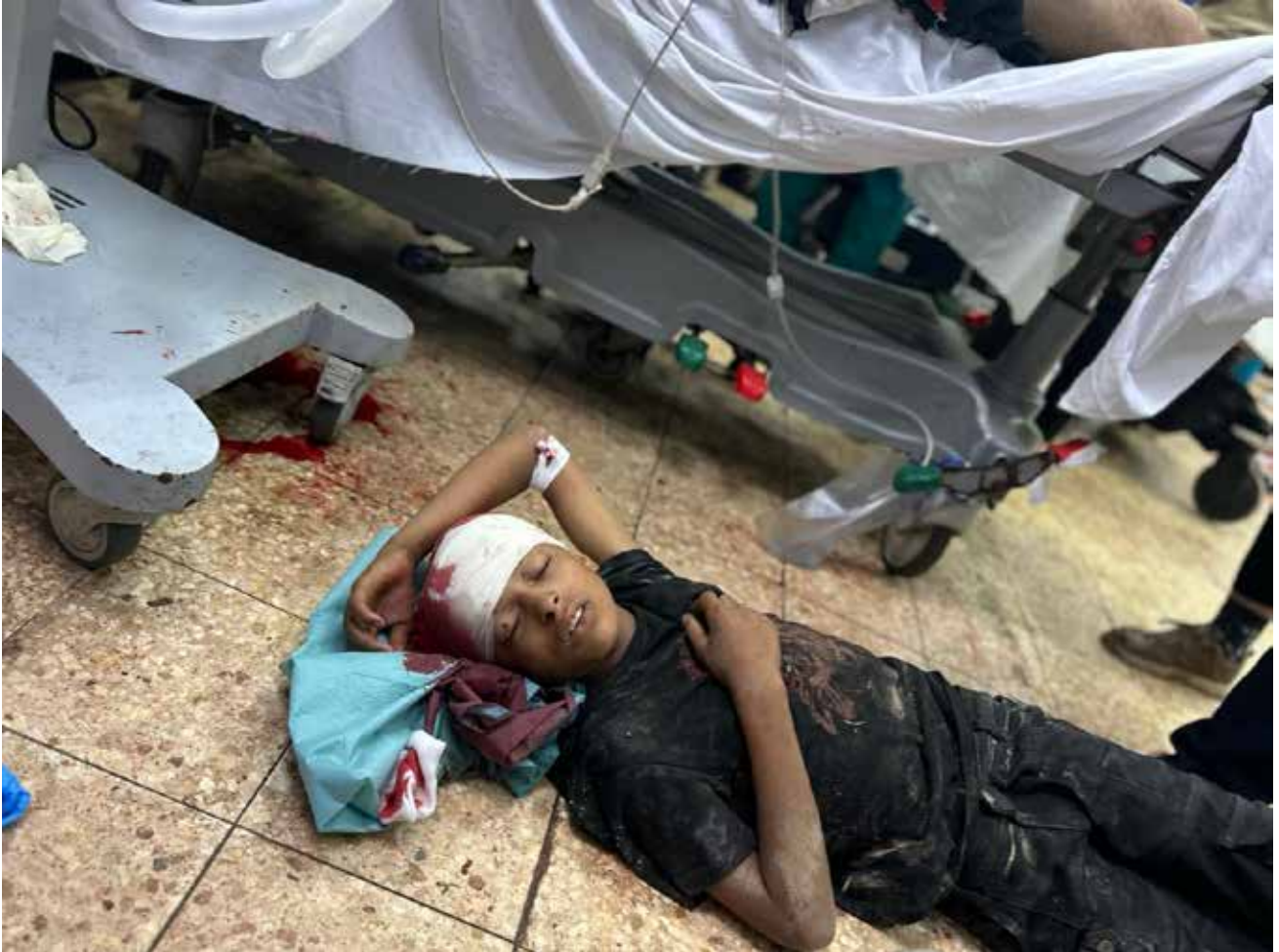
Imagen 125: Niño, de nombre y edad desconocidos, yace en el suelo del box de críticos de Urgencias. Presenta una fractura craneal abierta, con salida de material encefálico, en la región parietotemporal derecha, y coma. Formaba parte de un grupo de civiles que fue atacado por el ejército israelí, con artillería de tanque y disparos de fusil, mientras esperaban recibir ayuda en un punto de distribución habilitado por la ONU. En el ataque murieron más de 80 civiles y alrededor de 200 personas fueron heridas. (Jan Yunis, 17 de junio de 2025).