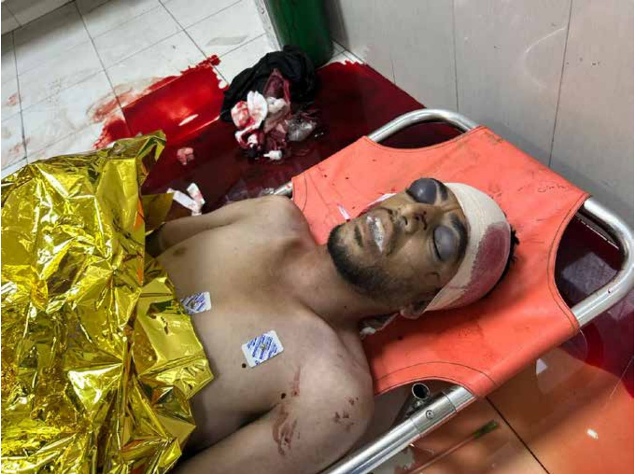
Imagen 88: Cadáver de un joven varón no identificado en el suelo del box de críticos. Como consecuencia de un bombardeo israelí, presenta un grave traumatismo craneoencefálico con fractura craneal abierta. (Jan Yunis, 3 de junio de 2025).