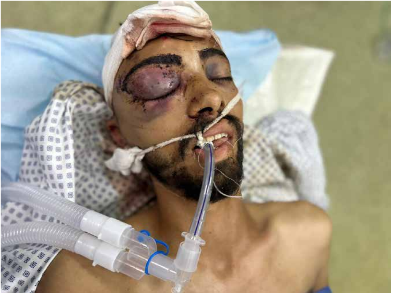
Imagen 136: Varón adulto, no identificado en el momento de la fotografía, es trasladado a quirófano para ser sometido a una craniectomía. La metralla procedente de una bomba israelí le ha producido fractura craneal, con hematoma epidural y subdural e isquemia cerebral frontal. (Jan Yunis, 24 de junio de 2025).