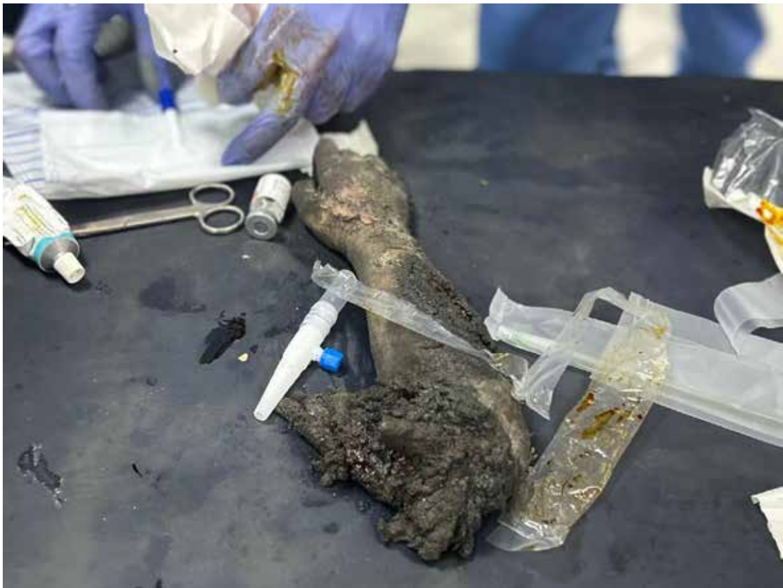
Imagen 17: Brazo derecho, amputado y parcialmente carbonizado, de Shaed, niña de 6 años herida tras un bombardeo israelí. Falleció a las pocas horas de su atención. (Jabalia, 28 de abril de 2025).