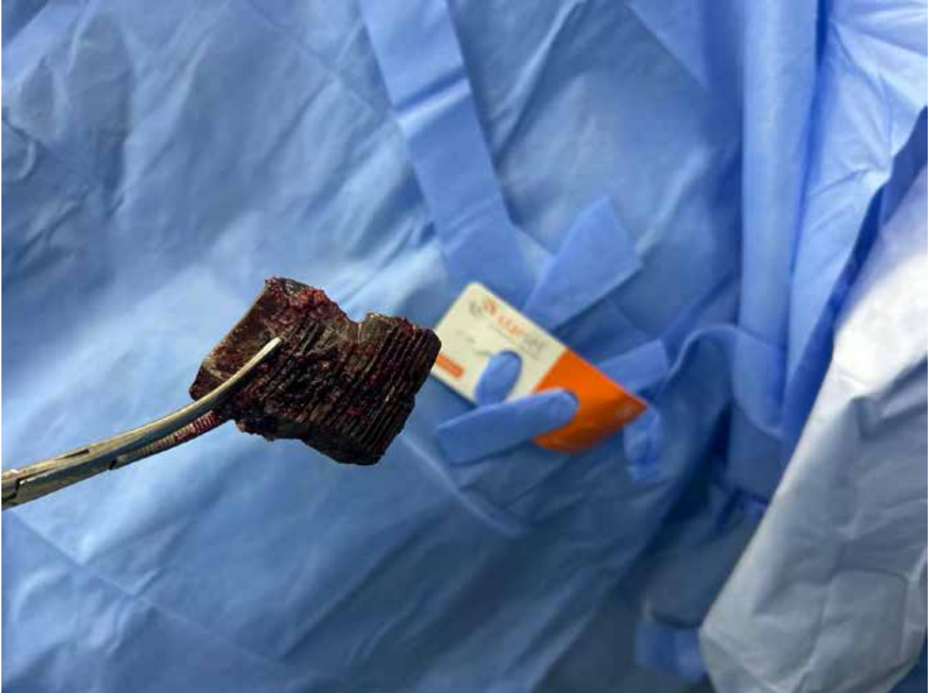
Imagen 118: Restos metálicos correspondientes a munición israelí de gran calibre, procedentes del abdomen de Mahmoud, de 19 años, quien, además de un abdomen catastrófico, presenta fractura craneal con salida del material encefálico. (Jan Yunis, 14 de junio de 2025).