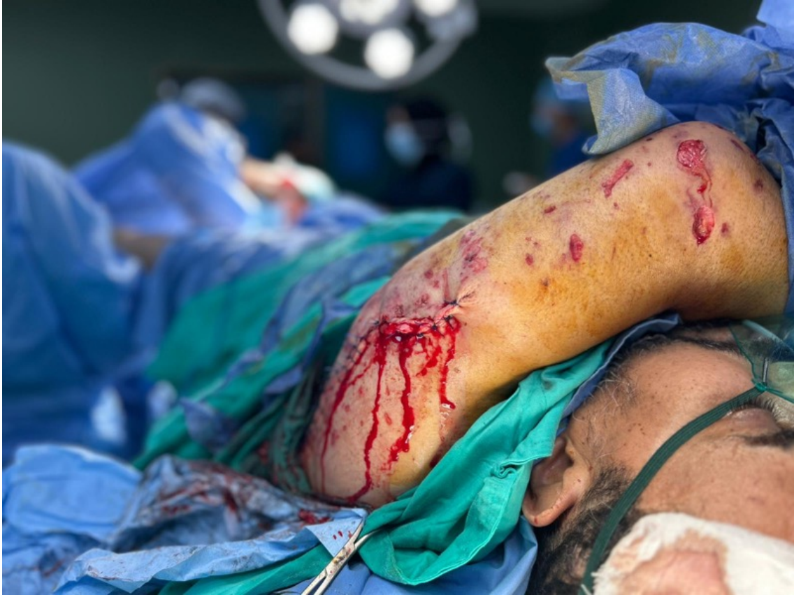
Imagen 33: Taher, de 47 años, es operado tras sufrir heridas graves en las piernas y perforaciones en el abdomen y el tórax causadas por metralla de una bomba lanzada por el ejército israelí. (Jan Yunis, 15 de mayo de 2025).