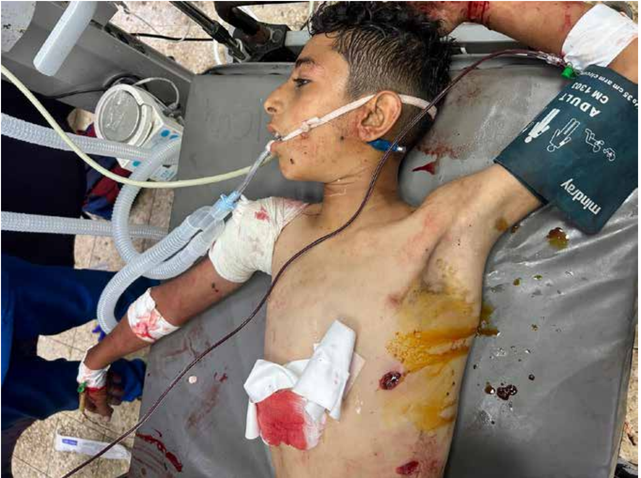
Imagen 127: Niño de aproximadamente 11 años, no identificado en el momento de la fotografía, es atendido en Urgencias. Presenta una herida abierta abdominal, con salida de parte de sus intestinos, y perforación torácica con hemotórax izquierdo, con grave shock hemorrágico asociado. Las heridas fueron causadas por metralla procedente de una bomba israelí. (Jan Yunis, 22 de junio de 2025).