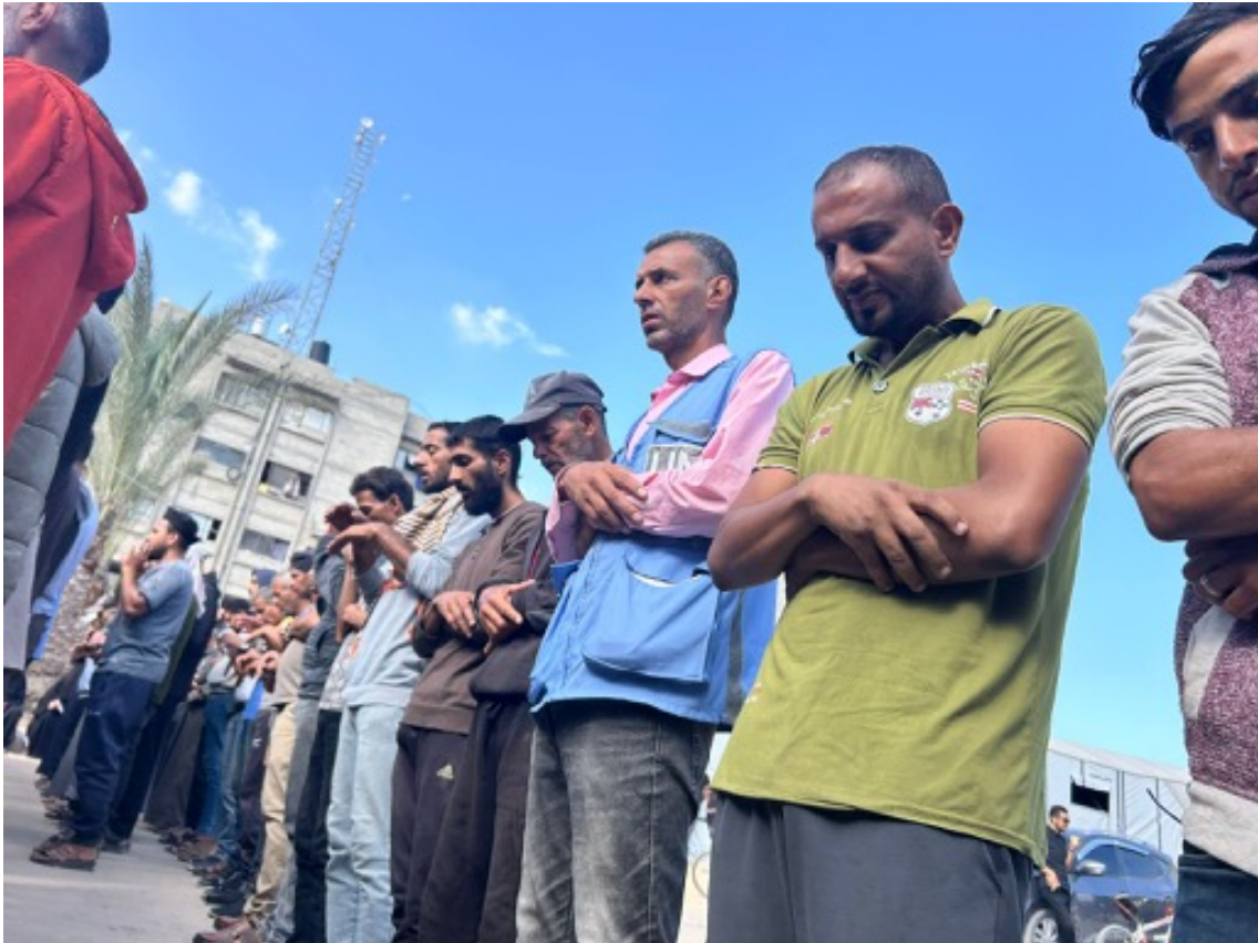
Imagen 45: Familiares de personas asesinadas por el ejército israelí rezan frente a la morgue del Hospital Nasser ante sus cuerpos amortajados. Les acompañan trabajadores del hospital. Entre los cadáveres hay varios niños. (Jan Yunis, 20 de mayo de 2025).