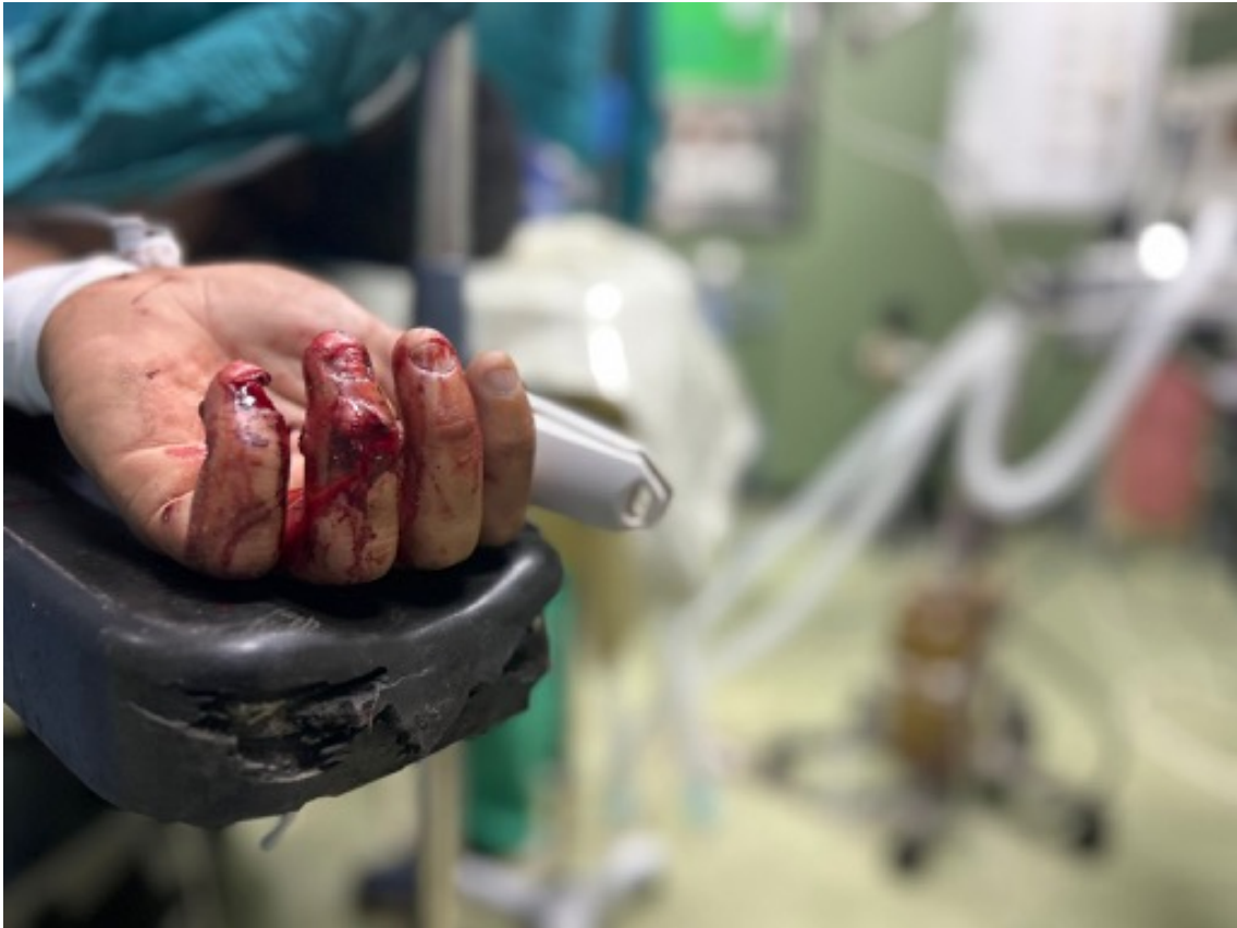
Imagen 27: Ibrahim, de 29 años, es operado de urgencia tras ser alcanzado por metralla de una bomba lanzada por el ejército israelí. La metralla perforó su abdomen y causó múltiples heridas en las extremidades. (Jan Yunis, 8 de mayo de 2025).