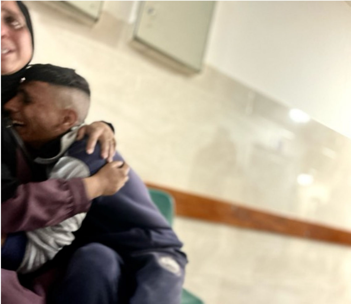
Imagen 6: El dolor de una madre y un hermano por la muerte de un joven de 15 años, asesinado por el ejército israelí en un bombardeo. Otro chico de edad similar también murió. Ambos fallecieron por las heridas provocadas por el impacto de la metralla. (Jabalia, 23 de abril de 2025).