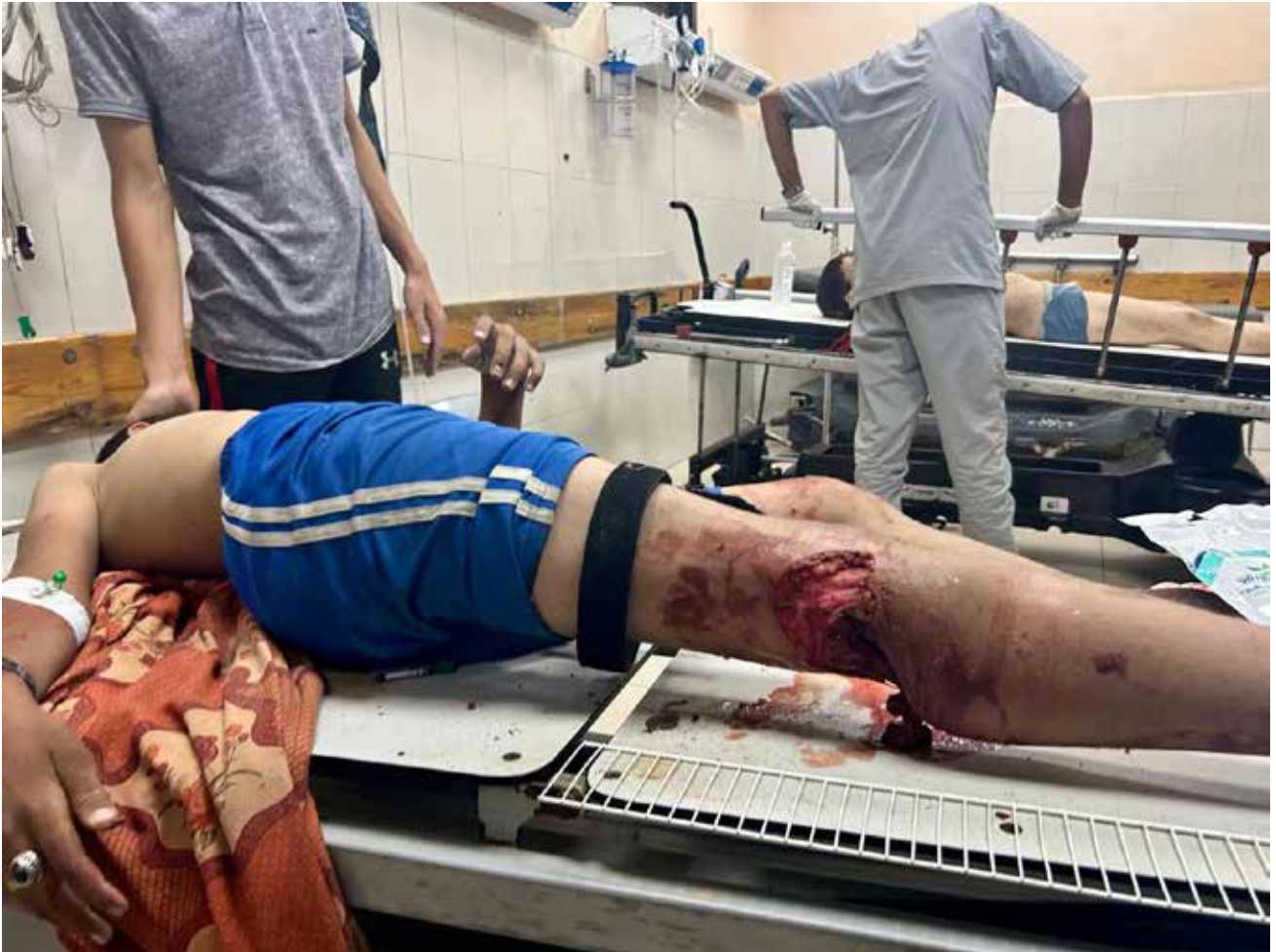
Imagen 128: Niño de aproximadamente 13 años, no identificado en el momento de la fotografía, es atendido tras sufrir un bombardeo israelí. Presenta herida profunda en la región poplitea de su pierna derecha, con afectación tendinosa y vascular. (Jan Yunis, 23 de junio de 2025).