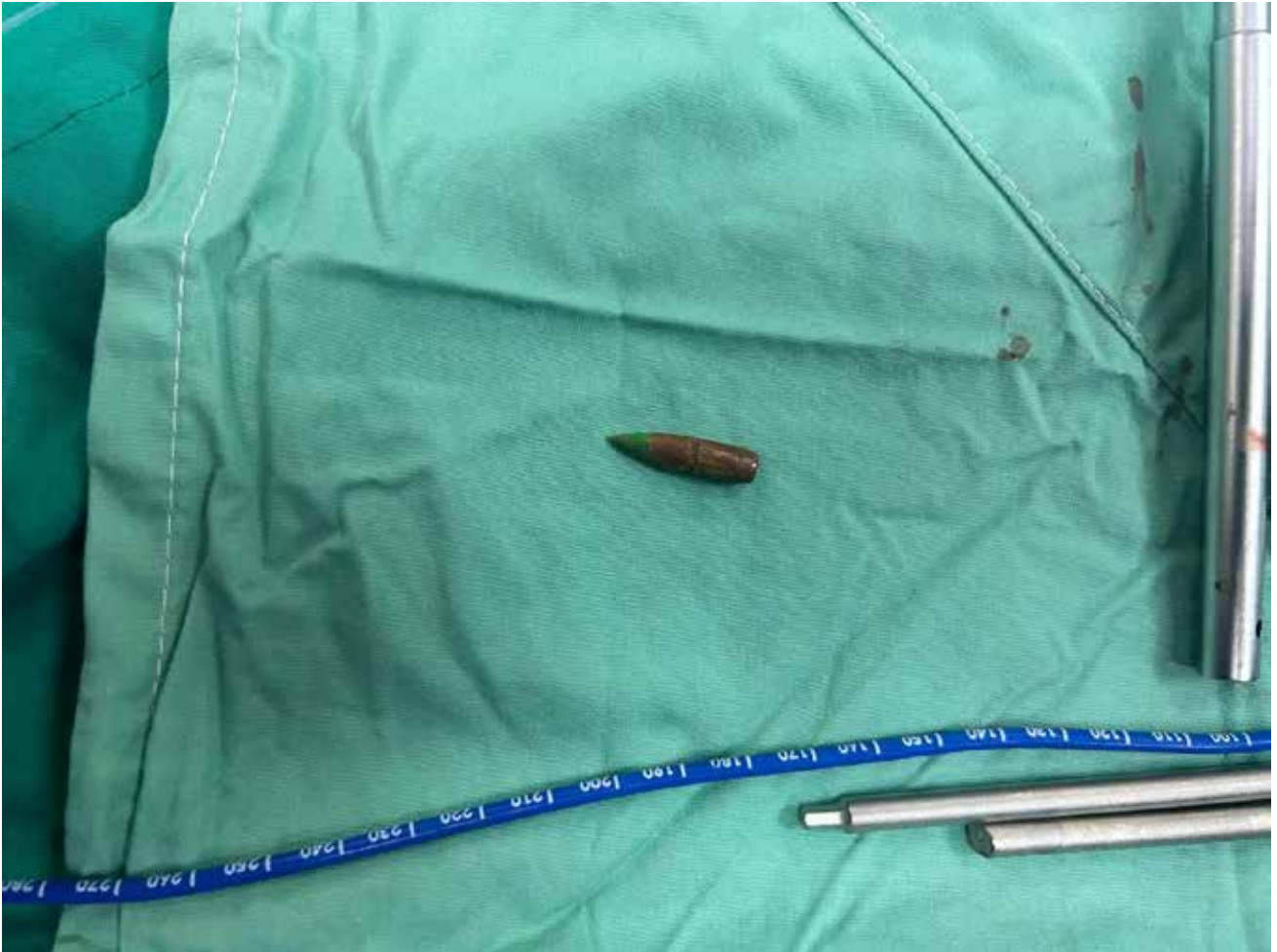
Imagen 154: Bala extraída de la columna vertebral de Adi Ibrahim, de 10 años de edad, disparado hace meses por el ejército israelí. Desde entonces ha permanecido parapléjico y no se espera que su condición neurológica mejore tras la operación de extracción de la bala. (Jan Yunis, 5 de julio de 2025).