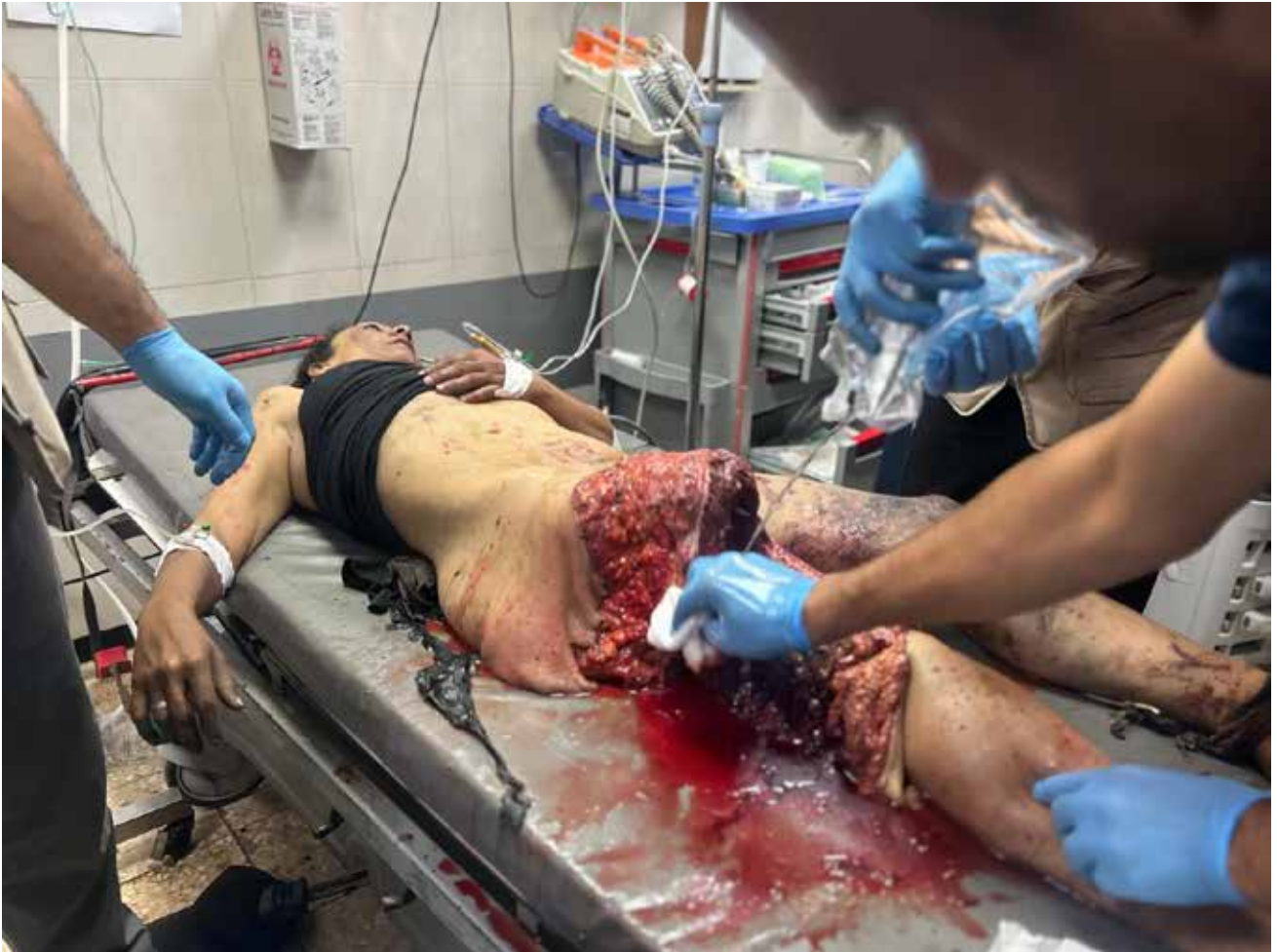
Imagen 106: Mujer no identificada en el momento de su atención en Urgencias, con amputación traumática de la pierna derecha como consecuencia de la explosión de una bomba israelí. (Jan Yunis, 8 de junio de 2025).