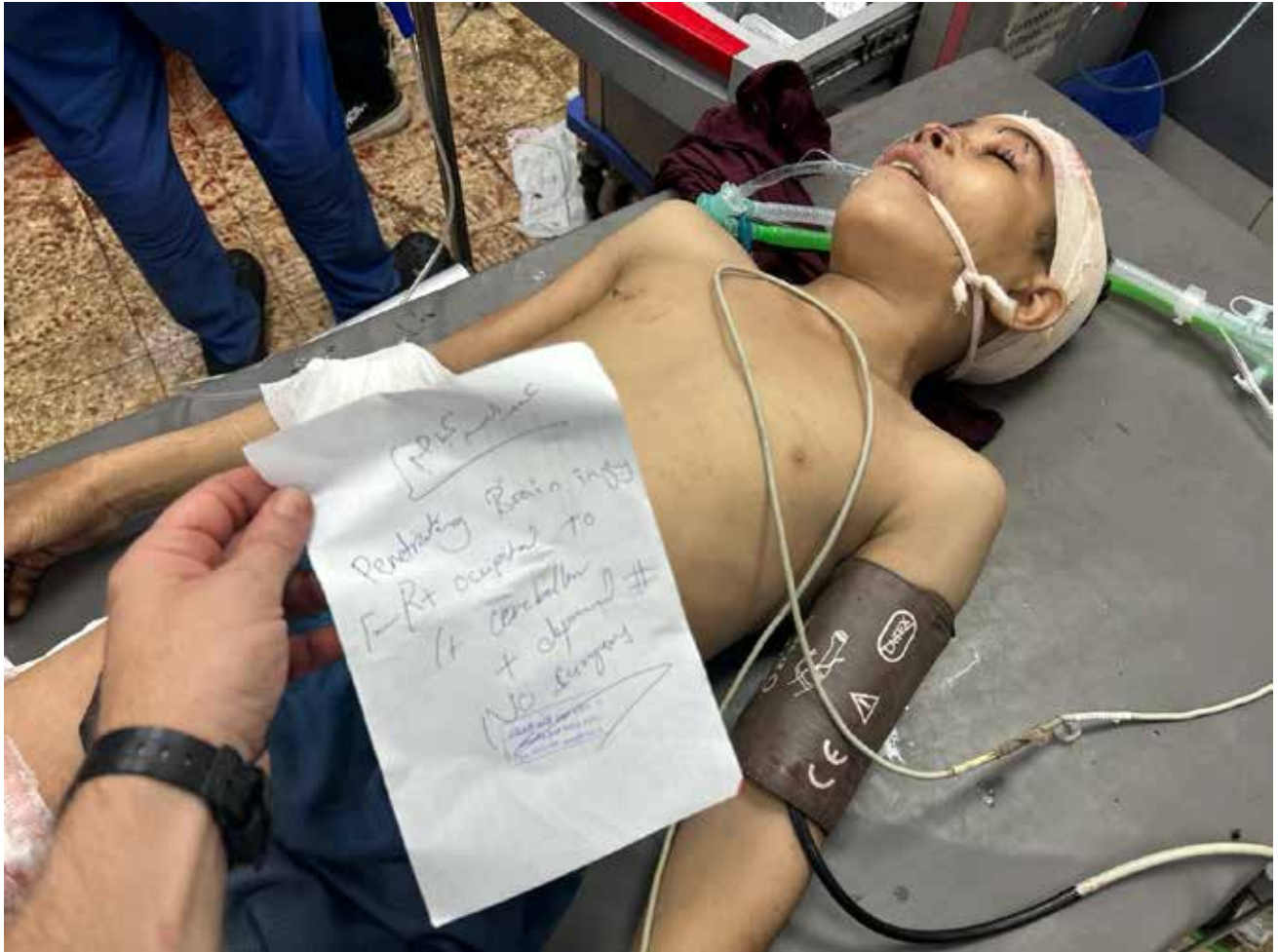
Imagen 123: Niño, de nombre y edad desconocidos, es atendido en Urgencias tras un ataque israelí. Presenta una herida penetrante en la cabeza, con daño cerebral y coma. El ataque, en el que se empleó artillería de tanque y balas de fusil, se produjo sobre población civil que esperaba un reparto de ayuda organizado por la ONU en Jan Yunis. Murieron más de 80 personas y fueron heridas alrededor de 200. (Jan Yunis, 17 de junio de 2025).